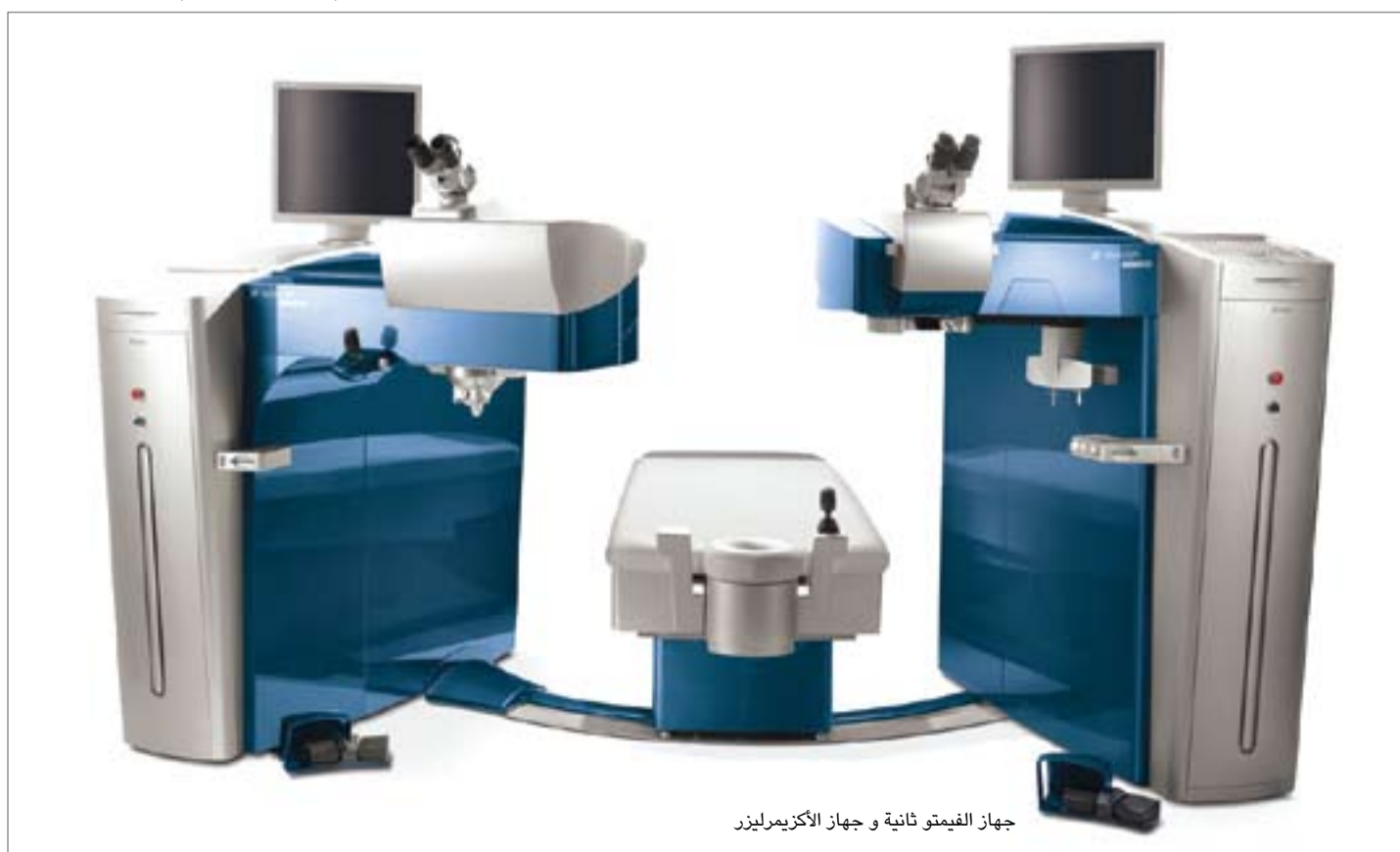
جهاز الفيمتو ثانية و جهاز الأكريزميرليزر