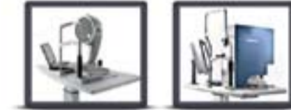
الأجهزة التشخيصية الدقيقة في نظام الويف ليزك